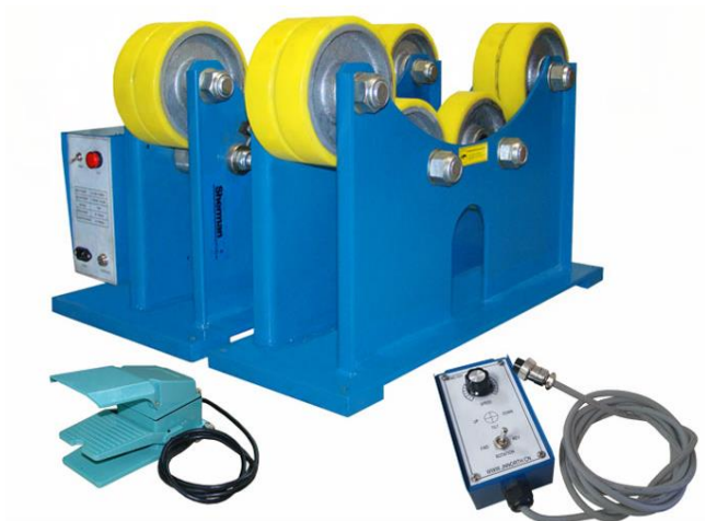
Rys. 1. Widok ogólny urządzenia