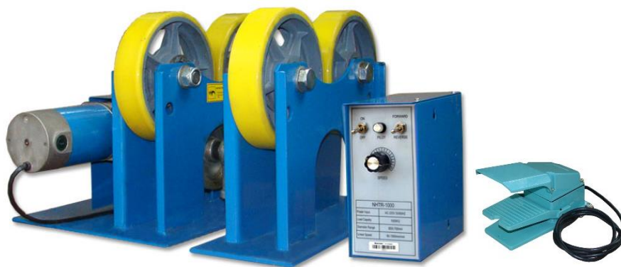
Rys. 1. Widok ogólny urządzenia