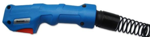
rękojeść typu TBI