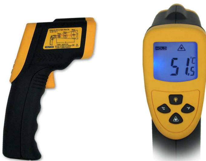
Rys. 1. Widok ogólny urządzenia

Pirometry na podczerwień 530C 750C służą do bezdotykowego, zdalnego pomiaru temperatury. Doskonale spisują się przy pomiarze temperatury gorących przedmiotów i miejsc trudnodostępnych. Niska waga i ergonomiczna obudowa powodują, że urządzenie jest wyjątkowo łatwe w obsłudze. Laserowa wiązka światła ułatwia precyzyjny pomiar. Podświetlenie wyświetlacza umożliwia użytkowanie pirometru w warunkach słabego oświetlenia. Zasilane są baterią 9V.